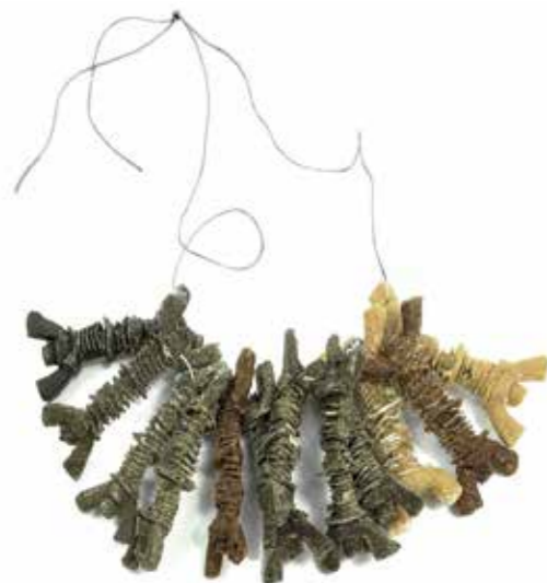
Mechanoorganicny naszyjnik, kawa z upraw ekologicznych, zioła, chili, imbir, pszenica i bawełna, klej, sznurek, 2020, 300 x 220 x 70 mm

Mechanorganic organic grown coffee, herbs, chili, ginger, wheat and cotton, glue, string, 2020, 300 x 220 x 70 mm