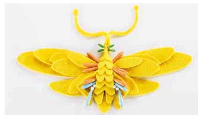
Transakcja dwa obiekty, mechaniczna gąsienica, filc, nić, zrekonstruowany koral i turkusz, kwarc różowy, biały agat, stal, farba, 2020, 280 x 190 x 100 mm

This organic skull was found by Herman Hermsen in the forest, in the Netherlands, while searching for mushrooms. From what kind of animal is not known.