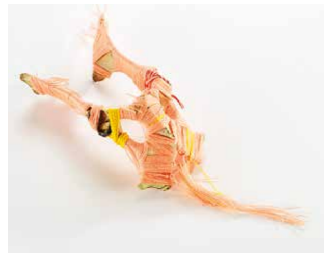
Ostatnie wyróżnienie obiekt, czaszka zwierzęcia, nici bawełniane, 2020, 80 x 160 x 51 mm

One last honor object, skull of an animal, cotton threads, 2020, 80 x 160 x 51 mm