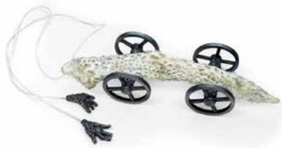
Mechanoorganicny obiekt, płaszczka, PLA, sznurek, 2020 300 x 80 x 60 mm

Mechanorganic object, ray fish, PLA, cord, 2020, 300 x 80 x 60 mm